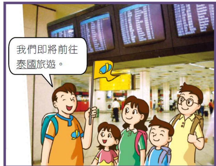
到外地旅遊的 香港 旅行團