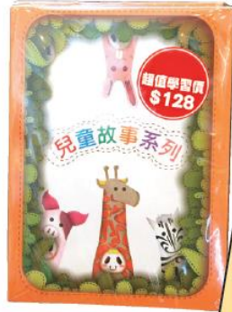
兒童故事書 $ 128