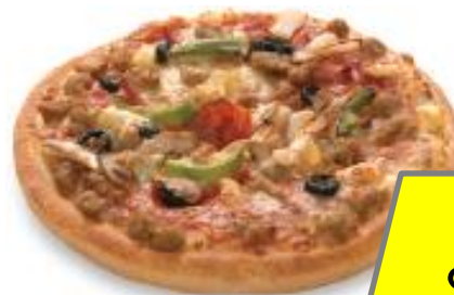
薄餅 $ 146