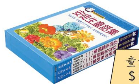
童話集 $ 950