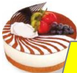
蛋糕 $ 180